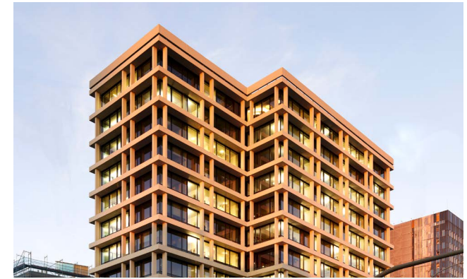
HAMBURG HEIGHTS - HEIGHT 1 (Top 3 2019)