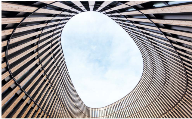
RATHAUS FREIBURG (Sieger 2019)